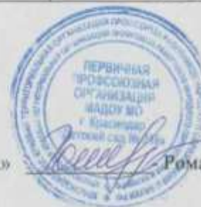
График составил Председатель профсоюзного Комитета МАДОУ МО г. Краснодар «Детский сад № 216 «Кораблик детства»